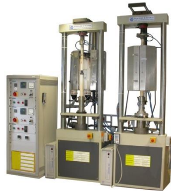
Nachrüstung Roell-Korthaus DSM 6102