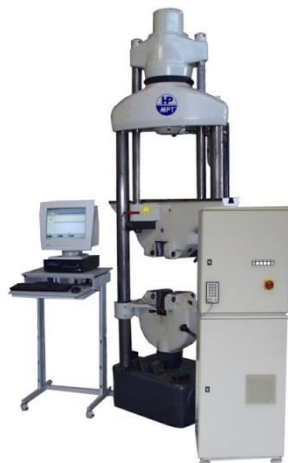
Nachrüstung MAN 600kN