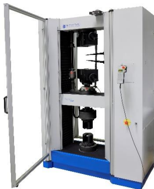
Nachrüstung UPM UTS-Eurotest 250/300kN