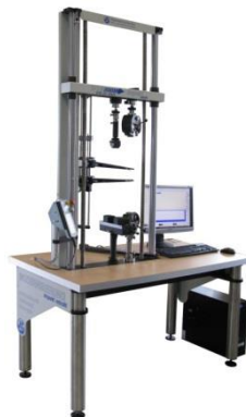
Nachrüstung UTS Typ 010.20 10kN