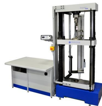
Nachrüstung UPM TIRAtest 24100 100kN