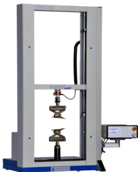
Nachrüstung Zwick 1435-5kN