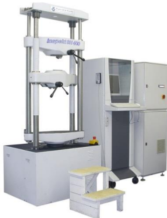
Nachrüstung EU40 40kN