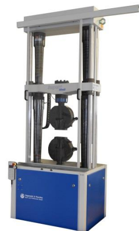
Nachrüstung Wolpert TZZ 250kN