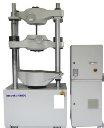
Nachrüstung Shimadzu 1000kN