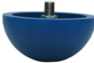
Artikel Nr. 41-006-750 Fallstempel für Bettenprüfung nach EN 716-2