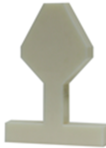
Artikel Nr. 41-007-353 Schablone für keilförmige oder unregelmäßige Öffnungen (DIN EN 716-2)