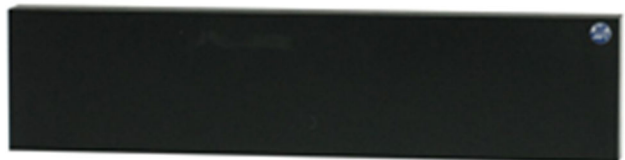
Artikel Nr. 41-007-385 Prüfgewicht 10 kg (100x30x425mm) entsprechend EN 716-2