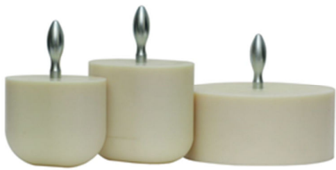
Artikel Nr. 41-007-355/ -356/ -359 Kopfschablonen mit Haltegriff