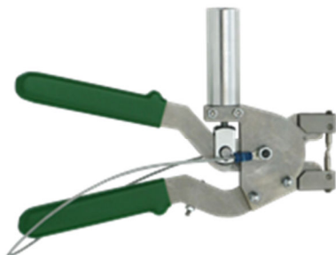
Artikel Nr. 41-007-360 Gerät für Reißprüfung entsprechend DIN EN 716-2