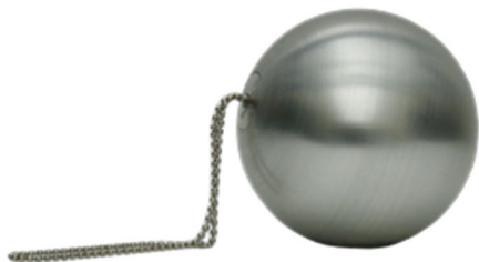
Artikel Nr. 41-007-340 Prüfkette mit Gewichtsstück 2,5kg entsprechend DIN EN 716-2