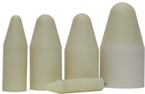
Prüffinger mit Gewinde in den Größen: 5mm, 7mm, 8mm, 12mm, 17mm, 18mm, 25mm